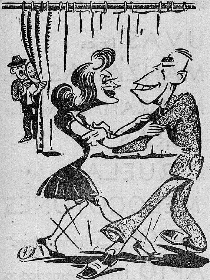
Cada rato anuncia don Otilio que se va para la finca. Esto es, que el Electo está en un puro baile con La Vieja. De modo que el hombre no está acalambrado.