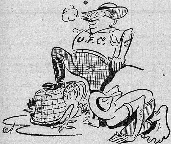
La Compañía Bananera tiene otro gallo tapado, un contrato para explotar los cicales de Costa Rica.

O, en otras palabras, ya viene "el coco".