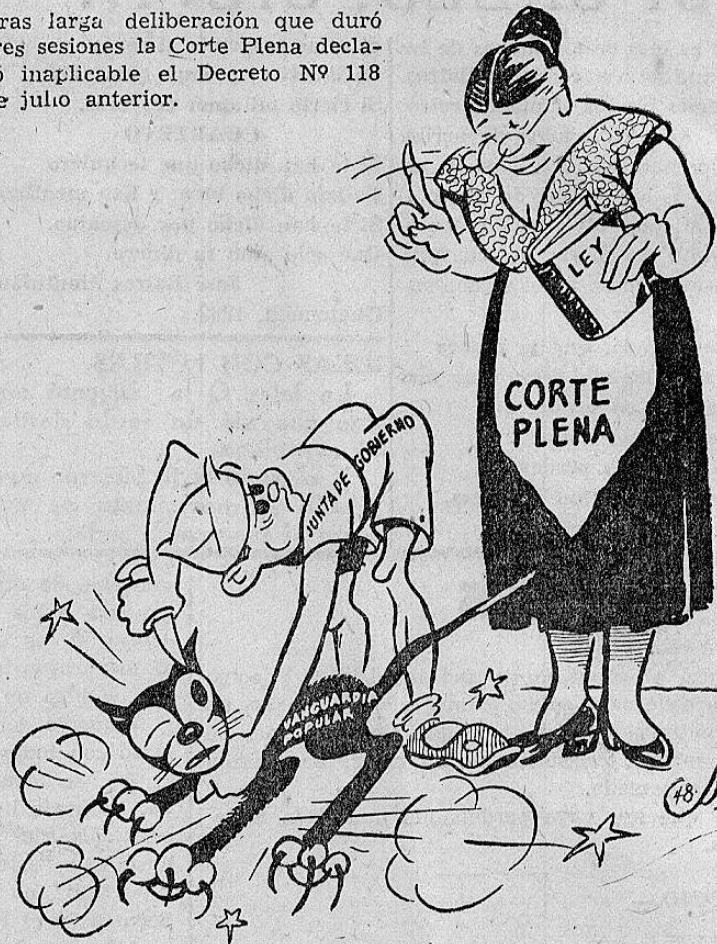
—Sacar los ojos a ese gato no podrás... —Inoportunas son a veces las mamás!...

Tras larga deliberación que duró tres sesiones la Corte Plena declaró inaplicable el Decreto N° 118 de julio anterior.